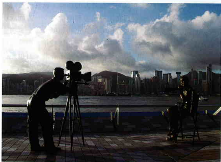
有華人的地方，幾乎就有香港電影

兩種文化截然不同，但香港由於獨特的歷史經驗，因此擁有很多懂得結合與平衡這兩種文化的人才。而這批人才，就是香港不能被一般城市取代的優勢所在。國家雖然改革開放30年了，但對於西方的文化和制度，始終有一定的戒心與不安。同樣，西方社會對中國的崛起亦心感不安。香港人可以做的，就是為雙方克服彼此的不安。透過掌握西方文化的底蘊，為中國提供豐富的資訊和分享實際的經驗，例如可以協助中央實施受規管和循序